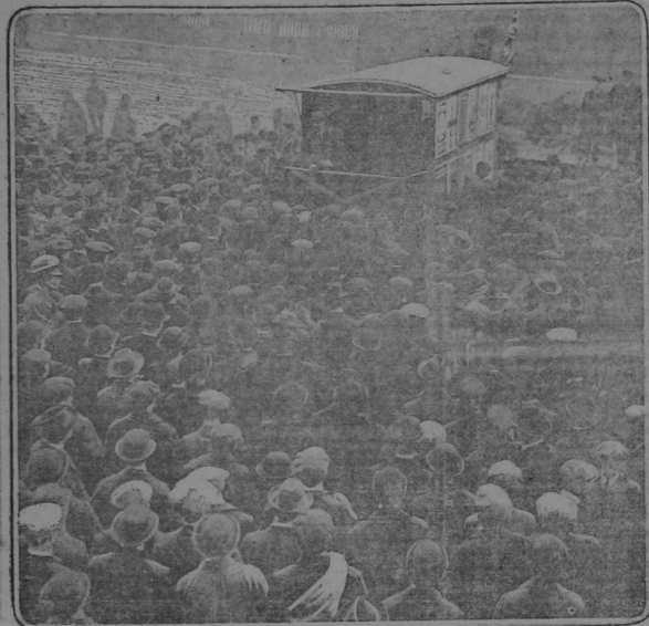
RECRUITING CAMPAIGN ON TOWER HILL, LONDON

THOUSANDS ANSWERING WAR CALL IN LONDON— GREAT ARMY RECRUITED